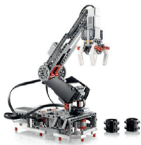
Иллюстрация: Денис Гришин / «Седьмая переменная»

В визуальном языке программирования Scratch не нужно соблюдать строгие правила написания кода. Код мы вообще не пишем, вместо него есть готовые визуальные блоки. Для получения результата их надо соединить в правильной последовательности.