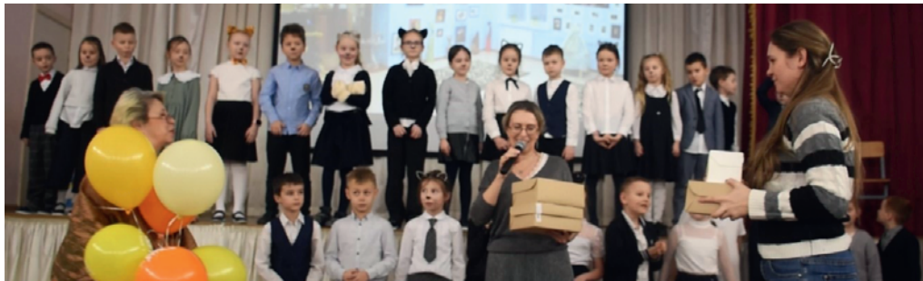
Фото: Григорий Михайлов / «Седьмая переменная». Руководитель музея Г.А. Крылова принимает подарки

тересные номера, в которые юные артисты вложили свою душу. Зрители чего только не увидели: и спектакль, и хор, и чтение стихов, и песни с танцами.