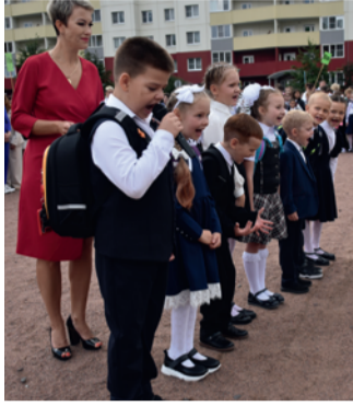
Фото: Григорий Михайлов / «Седьмая перемена». Первоклассники.

После линейки собравшиеся долго не расходились — общались, фотографировались возле зеленых насаждений.