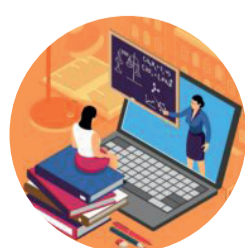
Инфографика: Евгения Райт / «Седьмая переменная».