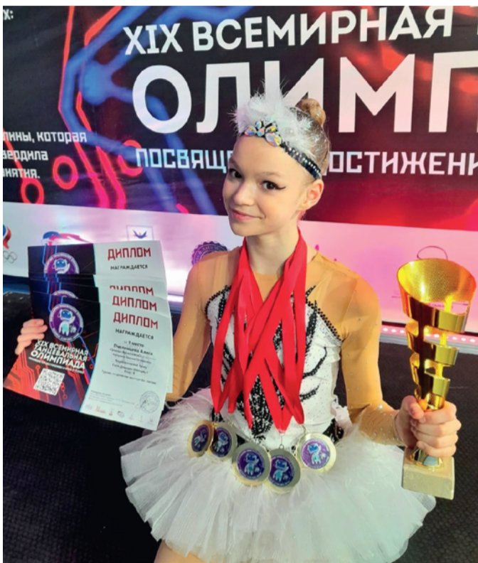
С наградами Всемирной танцевальной Олимпиады.

— Да, мы в перерывах всегда съедаем один кусочек шоколадки или банан.