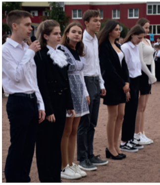
Фото: Григорий Михайлов / «Седьмая перемена». Одинадцатиклассники.