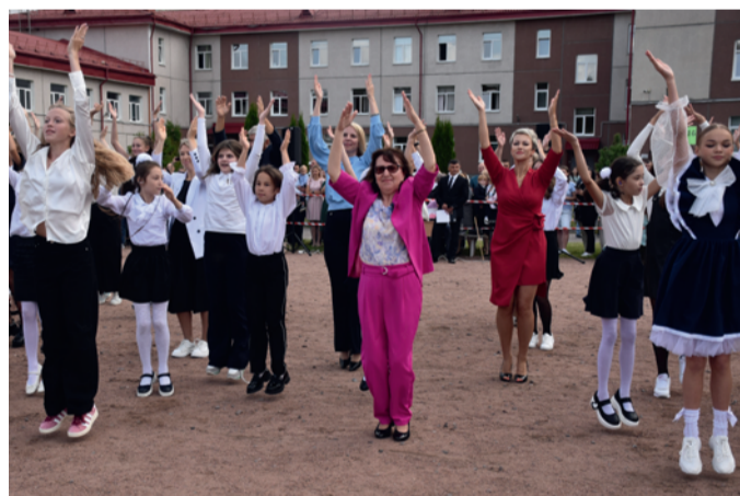
Фото: Григорий Михайлов / «Седьмая перемена». Изюминка 1 сентября этого года – флешмоб учеников и учителей.