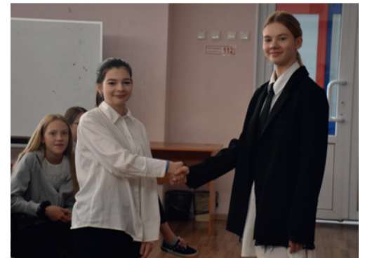
Рукопожатие кандидатов после оглашения результатов выборов.

— Она состоит в ШУСе, будет работать и в этом году.