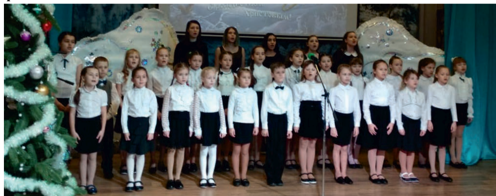
Хор "Мечта" МОУ «Всеволожский ЦО» выступает на фестивале детского и юношеского творчества "Русская сказка".

Хор МОУ «Всеволожский ЦО» стал дипломантом рождественского фестиваля