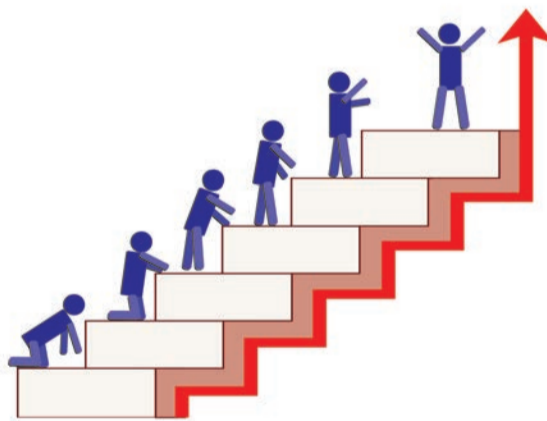
Инфографика: Екатерина Петухова / «Седьмая переменная».