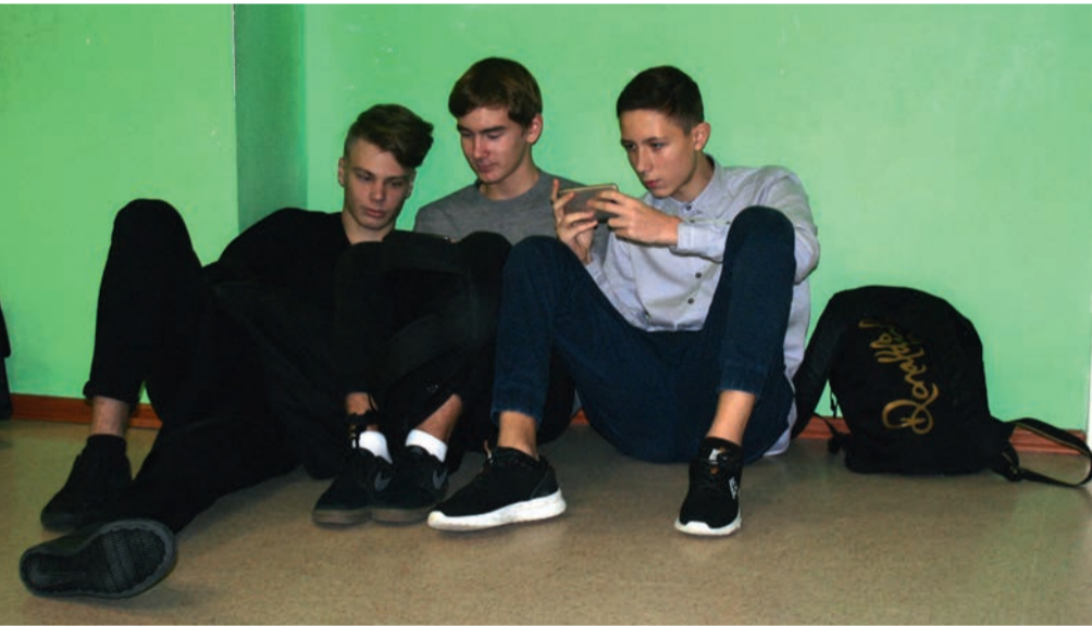
Foto: Григорий Михайлов / «Седьмая перемена». Парням из 9а комфортно в таком необычном положении.

Во многих странах в музеях, аэропортах и т.д. тоже сидят на полу. Но там тротуары моют с порошком и улицы достаточно чистые, люди следят за порядком. Опрятными наши улицы на-