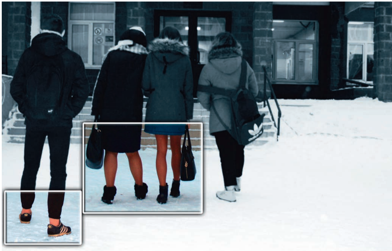
Снимок сделан у входа в нашу школу. Фотокорреспонденту ждало долго не пришлось - многие ученики одеваются в морозы не по сезону.

В погоне за модой школьники и студенты подвергают свое здоровье большой опасности