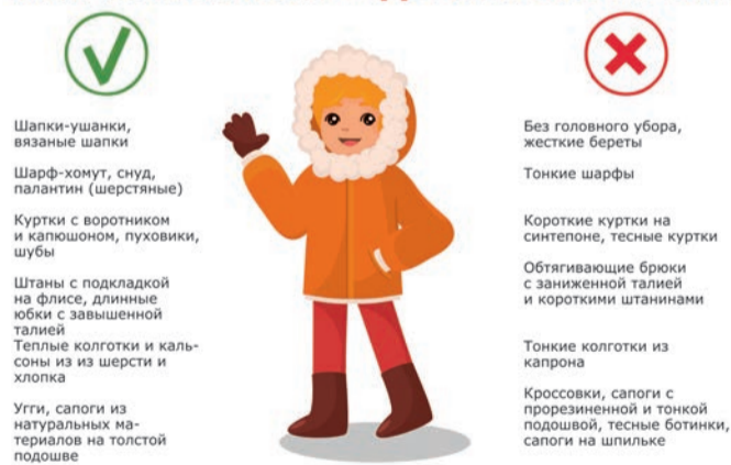
Инфографика: Екатерина Петухова / «Седьмая переменная».